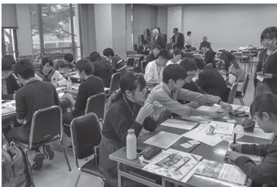
おもてなしLABO (アイデアを付箋に記入)