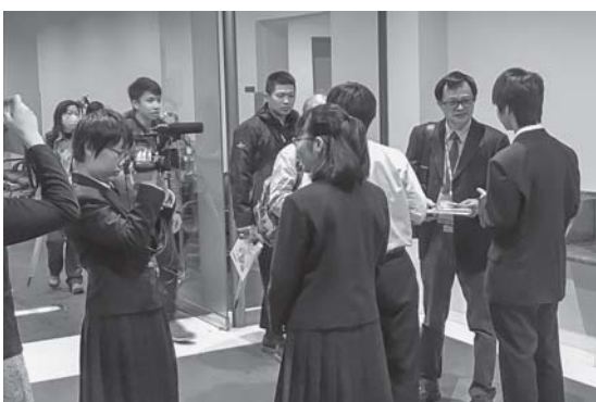
手渡しの様子①（幕総生徒も取材中）