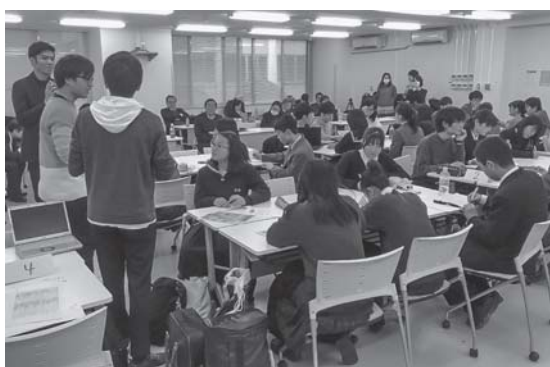
大学生によるレクチャー