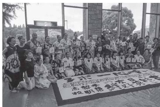
イギリスチームと千葉黎明高校の皆さん