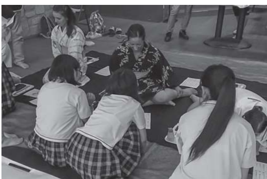
書道体験（千葉黎明高校）