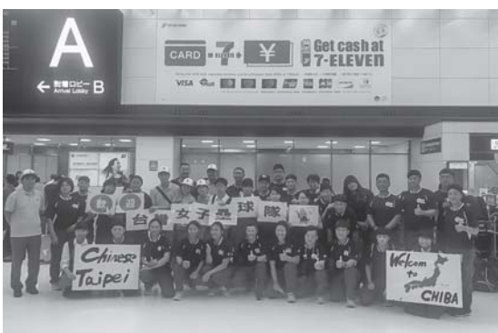
チャイニーズ台北選手団・受け入れ自治体の皆さんと