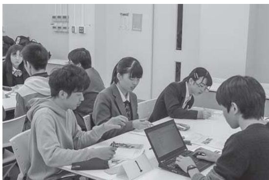
アイデアをまとめる高校生・大学生