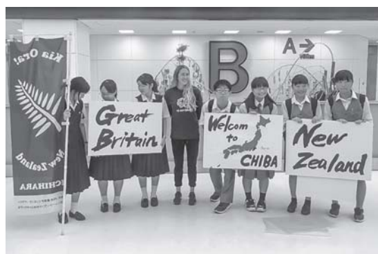
イギリスチームの選手とともに