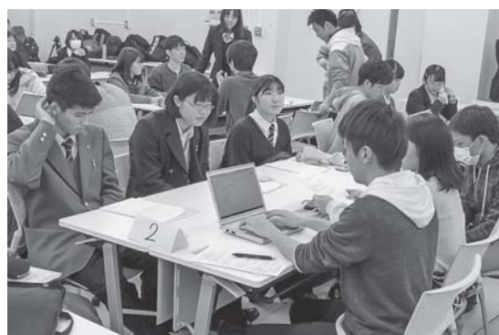
アイデアをまとめる高校生・大学生