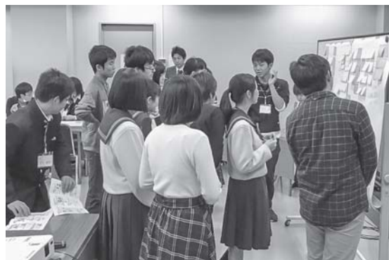
おもてなしLABO (アイデアを前に意見交換)