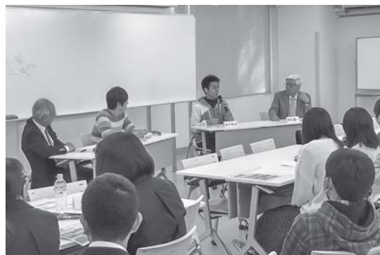
ゲストスピーカーの皆さん