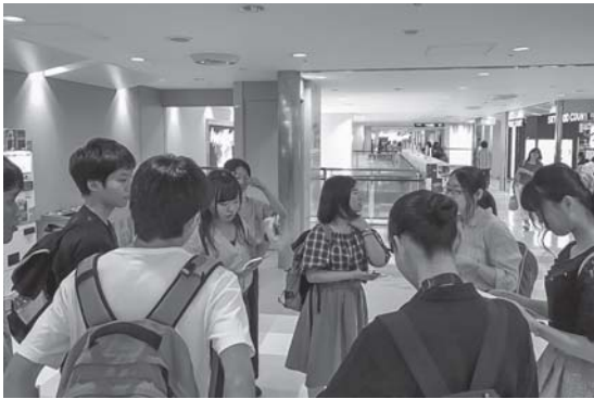
成田空港の様子をチェックする大学生の皆さん