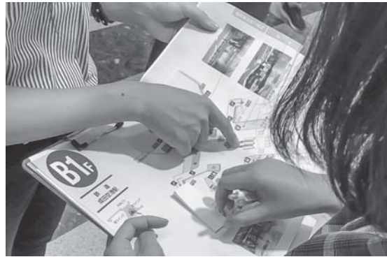
成田空港の様子をチェックする大学生の皆さん