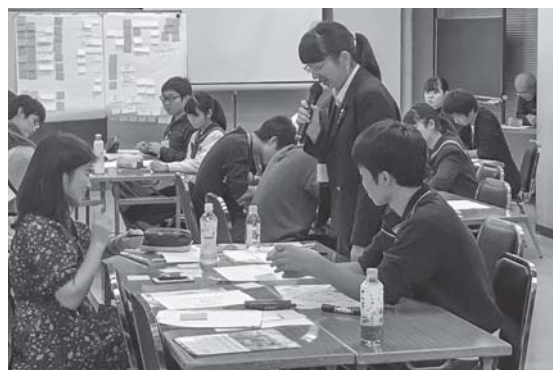
おもてなしLABO (グループ討議の結果発表)