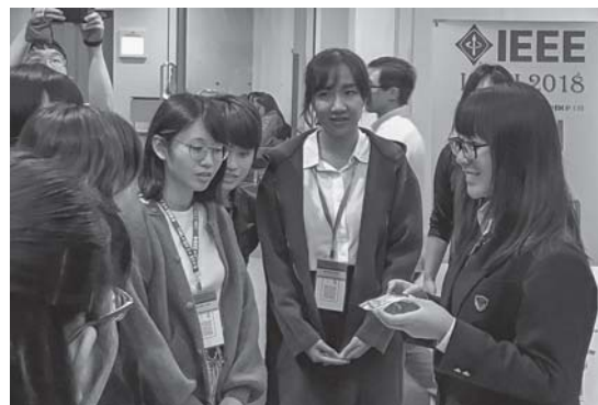
ロビーにいた参加者を相手に予行演習