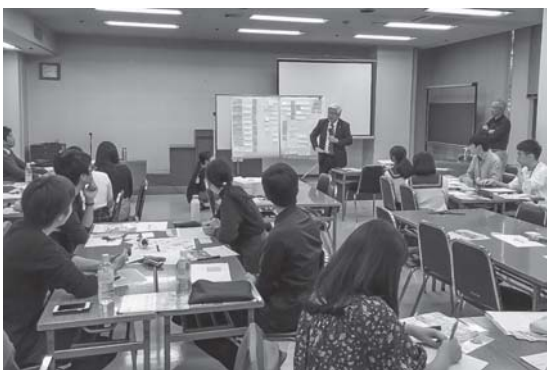
おもてなしLABO (助言者から)