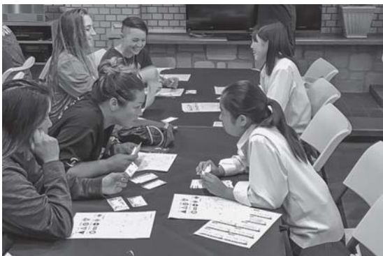
やさしい日本語講座（松尾高校）