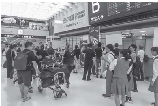
ニュージーランドチームの出迎え