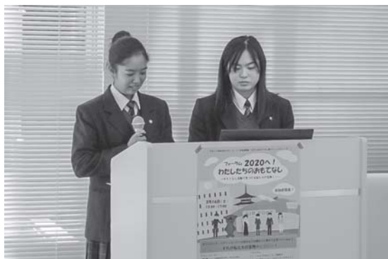
おもてなし活動を紹介