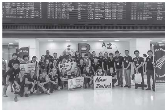
ニュージーランド選手団・受け入れ自治体の皆さんと