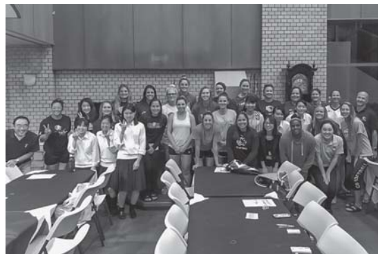
イギリスチームと松尾高校・大学生の皆さん