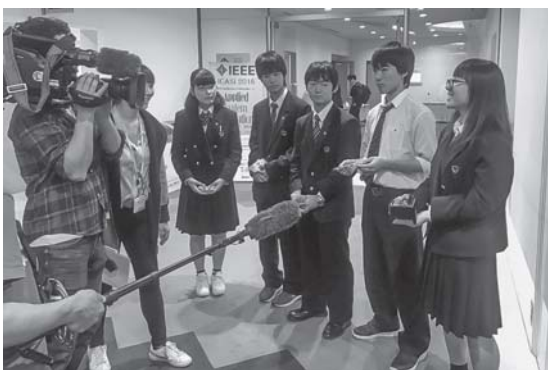
NHKによる生徒のインタビュー